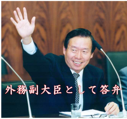
外務副大臣として答弁

西洋医学と伝統医療、とくに東洋医学との融和をはかり一人ひとりの個性、体質に応じた医療体制の確立をめざします。